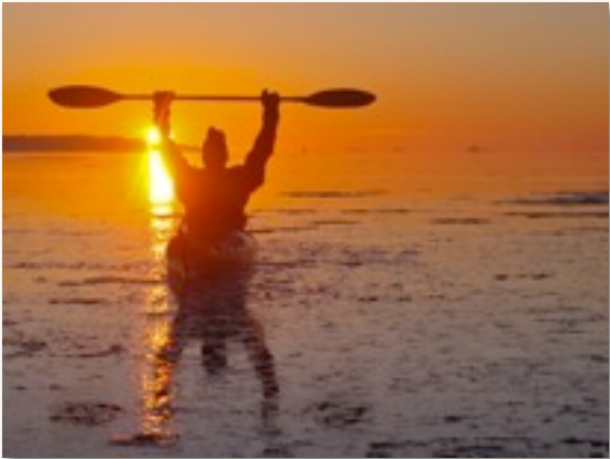
«Ny dag - nye muligheter» Solen står opp av havet en vakker januarmorgen 2010.